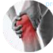
Gelenkerkrankungen (Arthritis, Arthrose)