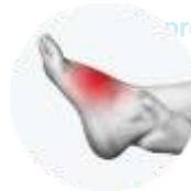
Schwellungen, Schmerzen, Beinverletzungen